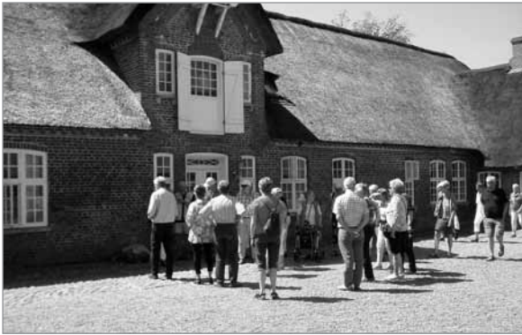
Klægager i Ballum