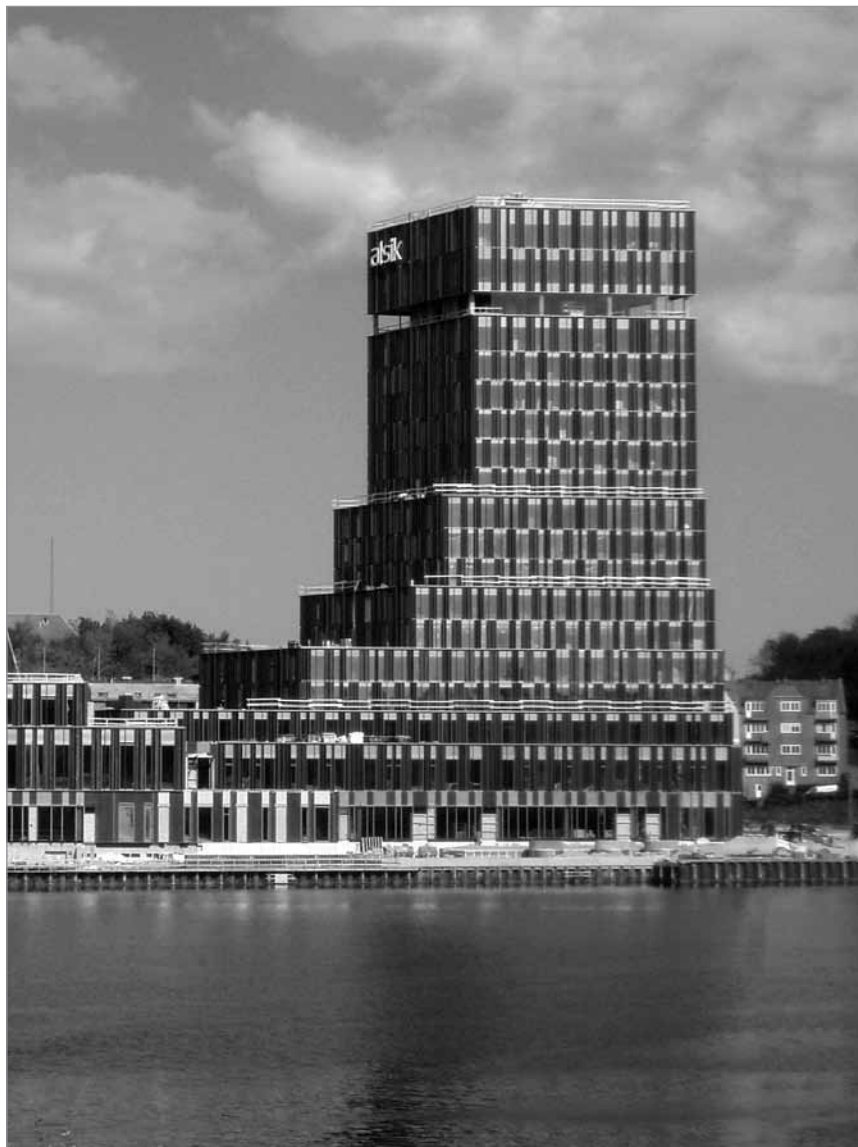
Så nåede Sønderborgs nye skyskraber sin fulde højde og omfang