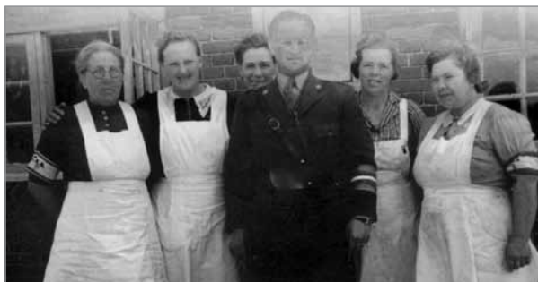
DKB-kvinder fra Ulkebøl

Under opholdet på skolen blev de bispist af DKB (Danske Kvinders Beredskab), der lavede mad i Ulkebøl Forsamlingshus.