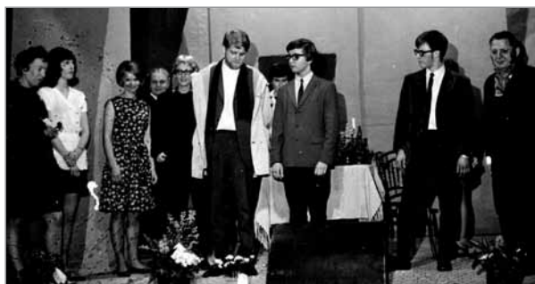
Fra forestillingen i 1970 "I brændingen".

UIU amatørteater har i mange år opført teaterstykker på forsamlingshuset og i nogle år var der også revy.