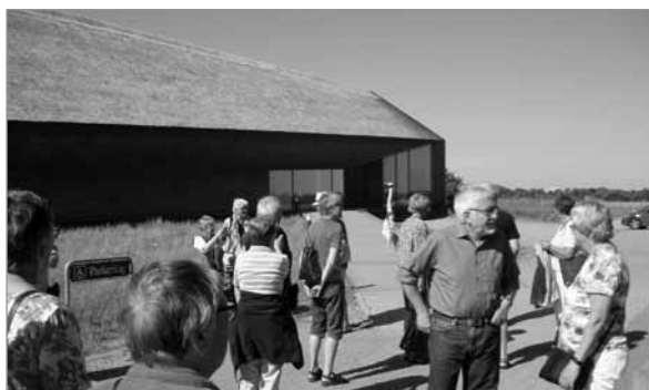
Vadehavscentret i Vester Vedsted

Fra Vadehavscentret kørte vi til Ballum for at besøge gården Klægager, som i 2017 blev kåret til Danmarks smukkeste bondegård i en landsomfattende afstemning. Gården er en typisk marskgård, med en typisk høj beliggenhed – og den er meget smuk.