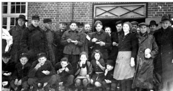
Holdet, som gravede vandværk ned får sig en bid mad

Der blev også lagt vand ind, og det var frivillige som gjorde det grove arbejde.