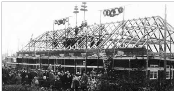
Rejsegilde med mange gæster

Mandag den 20. oktober 1930 kunne provst Thyssen nedlægge grundstenen til dette hus. Rejsegildet blev holdt den 14. november 1930 med 14 kranse og 70 gæster med kaffebord.