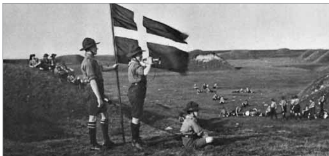
Danske spejdere i Dybbøl- skanser

Forkortet artikel af Viggo Jørgensen, 1981