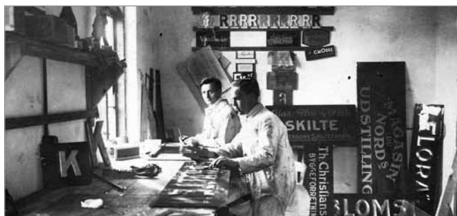
Værkstedet på Kongevej