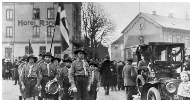
Spejderne tråd an på havnen