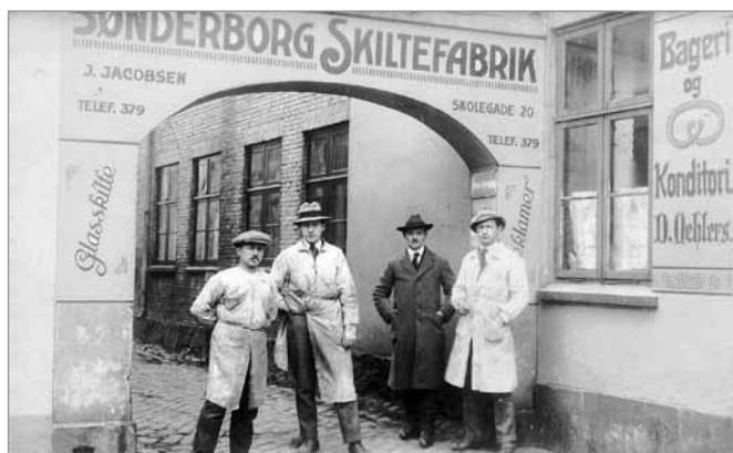
Værkstedet ved Rønhaveplads