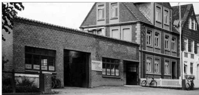
Værkstedet på Kongevej efter udvidelsen