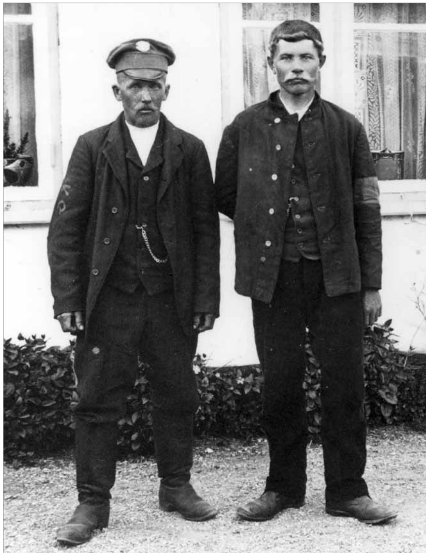
Bantzug og Baloba, russiske krigsfanger fra første verdenskrig på Østals. De flygtede i krigens sidste år til Fyn i en lille båd.