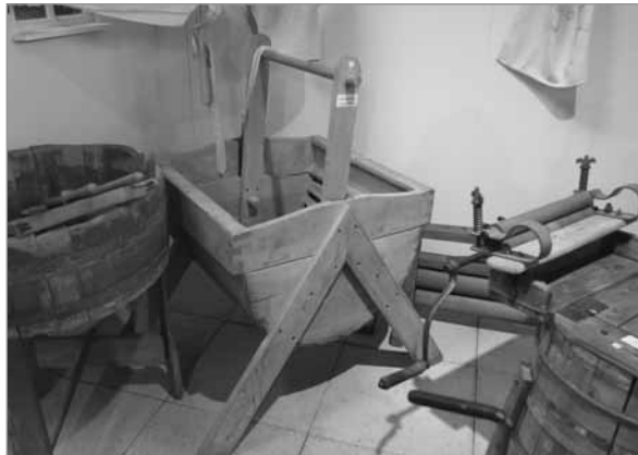
Redskaber til tøjvask