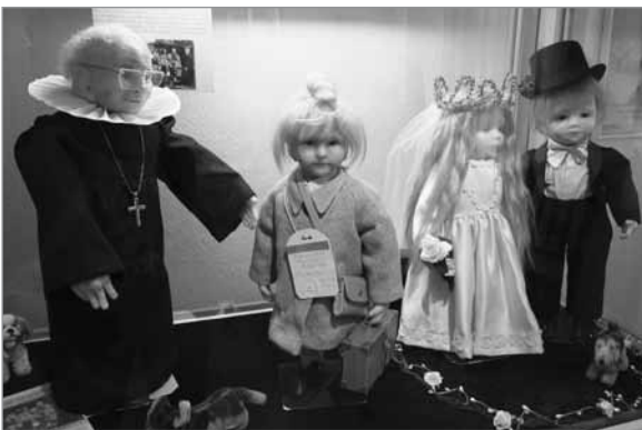
Udstilling i stuehuset: "Kunstnerdukker" af Inge Harck