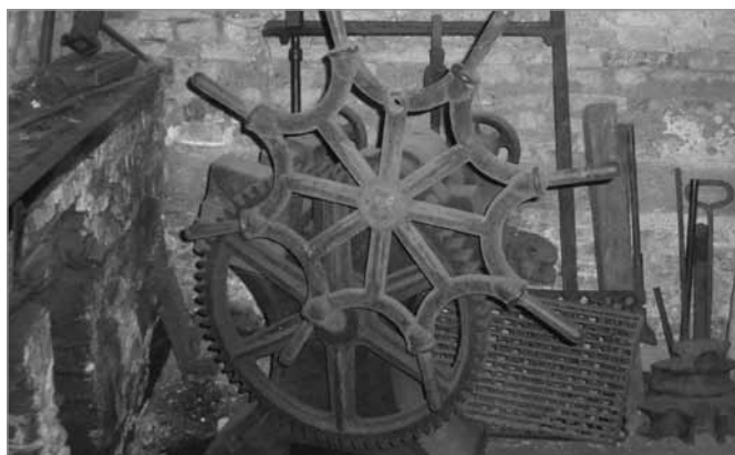
Maskine til bukning af hjulringe