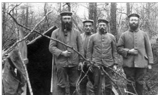
Russiske krigsfanger i Ulkebøl