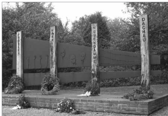
Mindesmærke for national- socialismens ofre