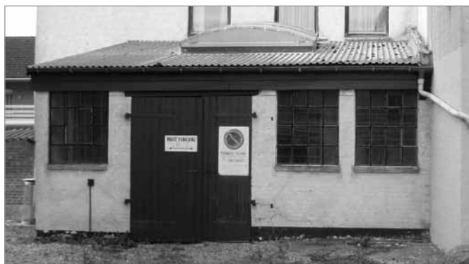
Smedien på Brandtsgade