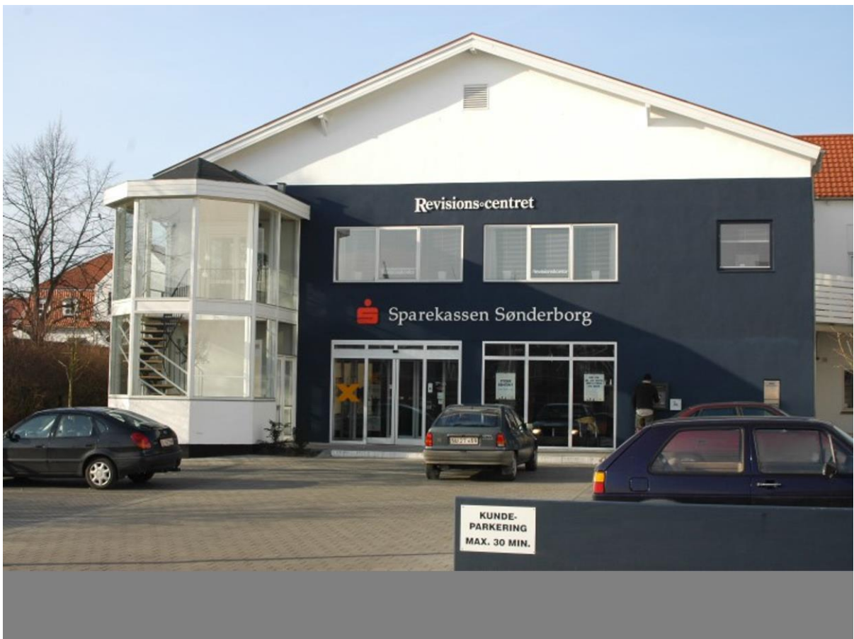
Broager sparekasse, i en del af huset har Wohlenbergs vinhandel til huse. I dag Sparekassen Sønderborg.