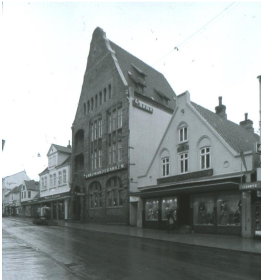
Den Danske Bank Perlegade 26 oprindelig Sonderburger Bank, fra 1920.