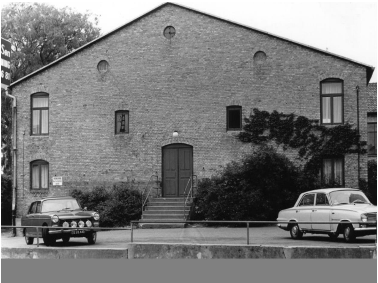
Kastanie Allé hvor vi kan se bagsiden af den gamle teatersal - teaterhotel Perlegade.