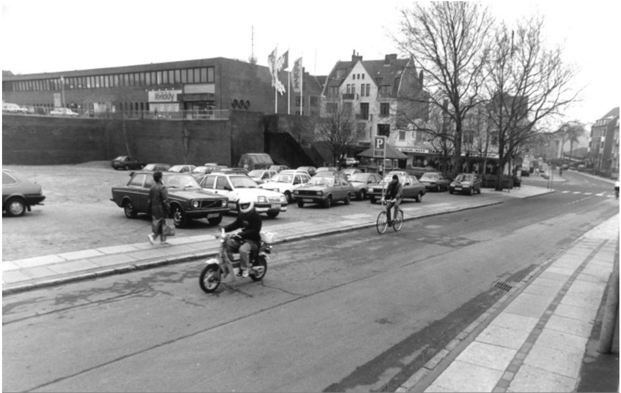
P. pladsen ved Kvickly's torv lå hen i årene 1989 — 92, mange planer om bygning af forretningsejendom.