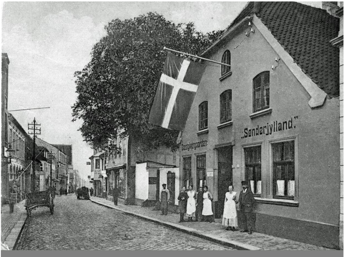
Perlegade - Restaurant "Sønderjylland" oprindeligt en købmandsgård fra 1771 nedrevet i år 2000.