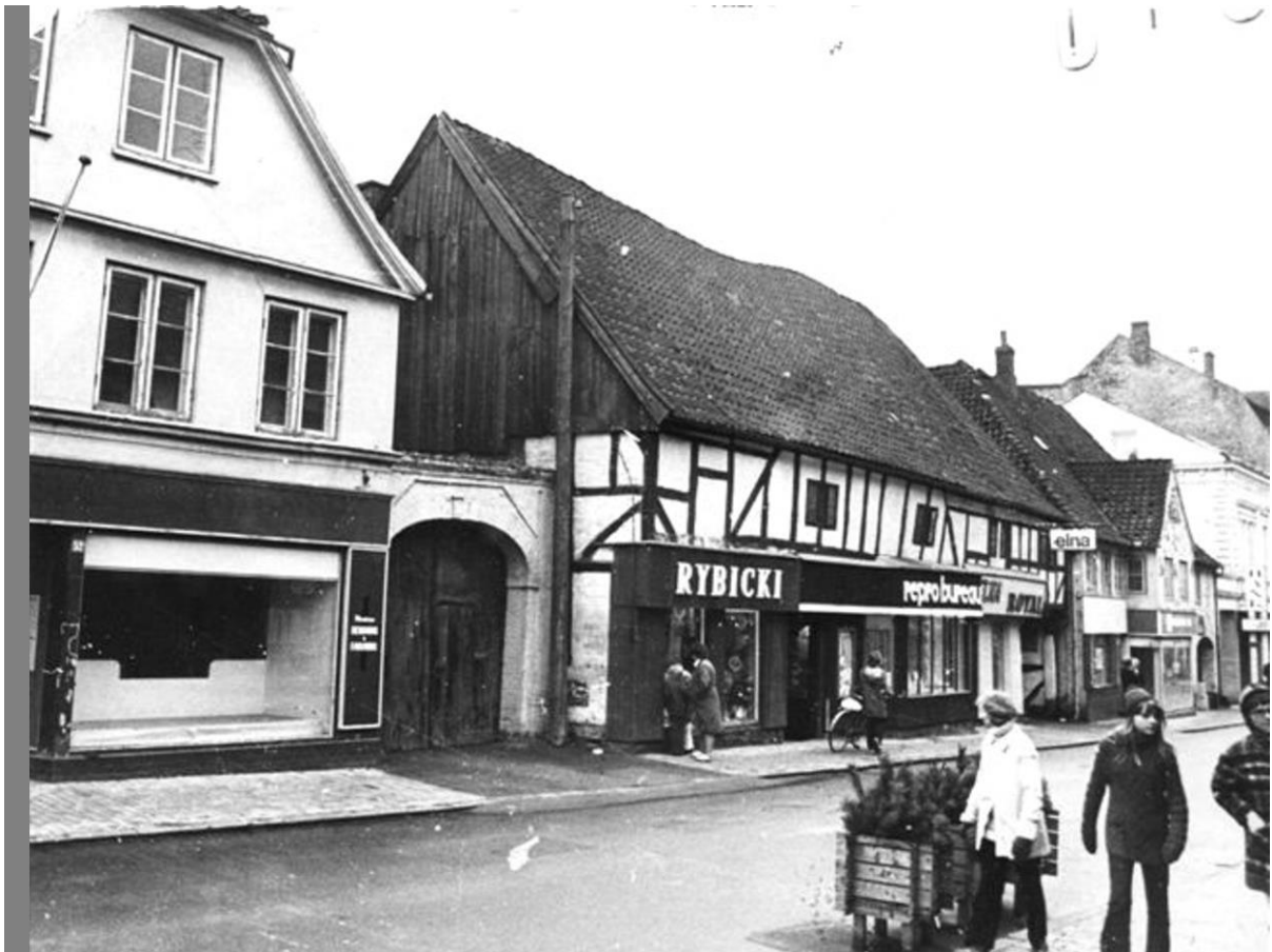
Perlegade 48 - 50 var et gammelt bindingsværkshus, med butikker som Søby - cykelhandler og i gården smedeforretning - også salg af symaskiner m.m.