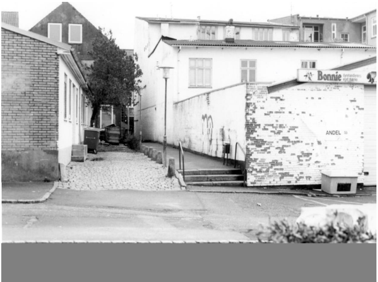
Trykkergangen - til højre garage hvor der i gammel tid var maskinværksted som brændte.