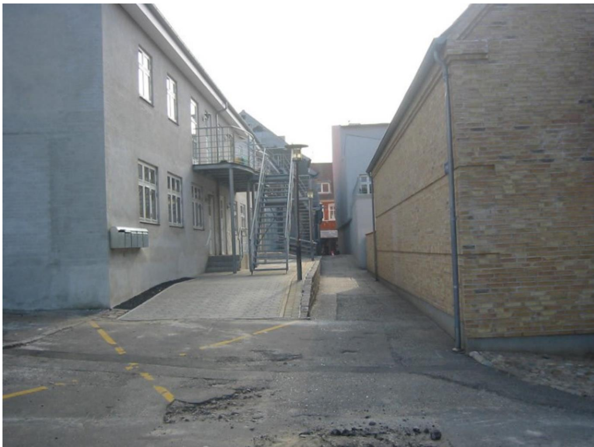
Trykkgangen i dag.