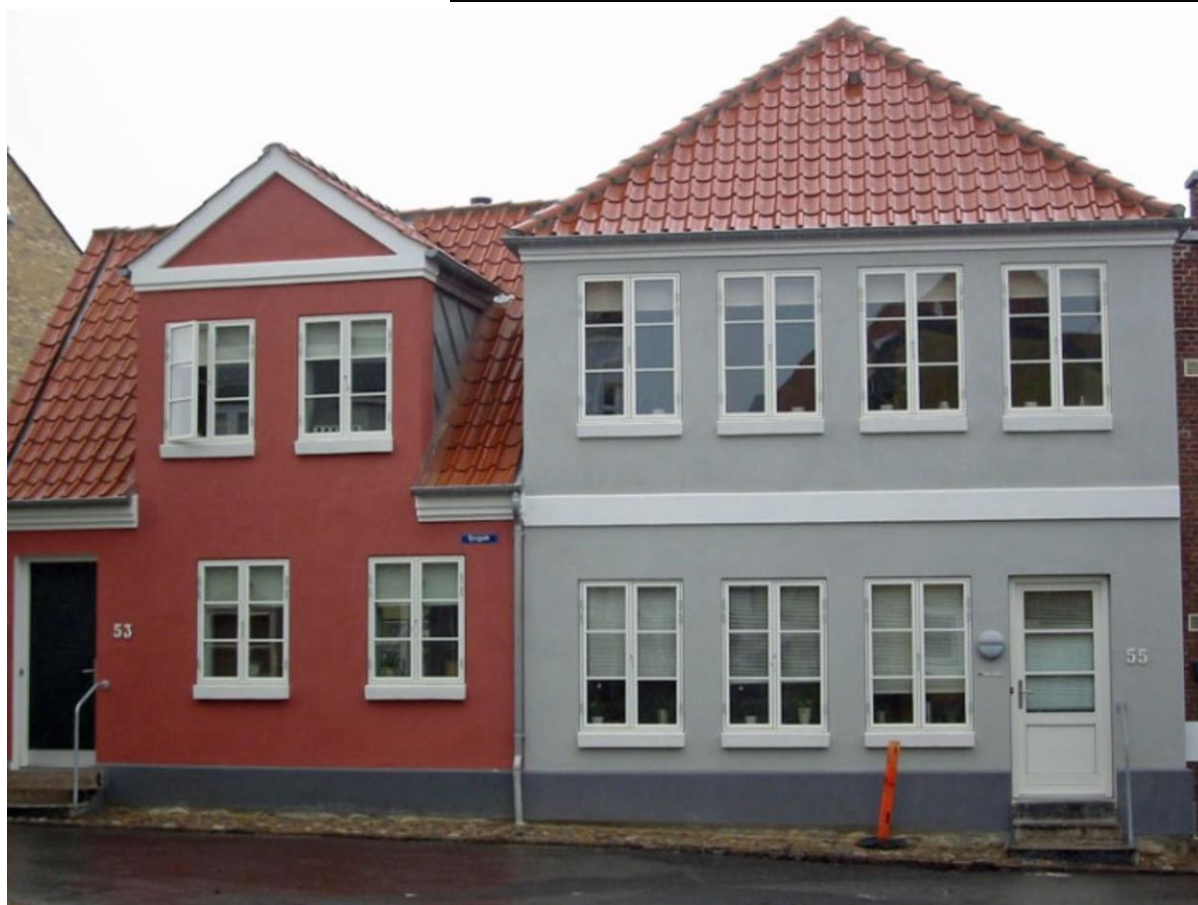
En tro kopi af de to huse.