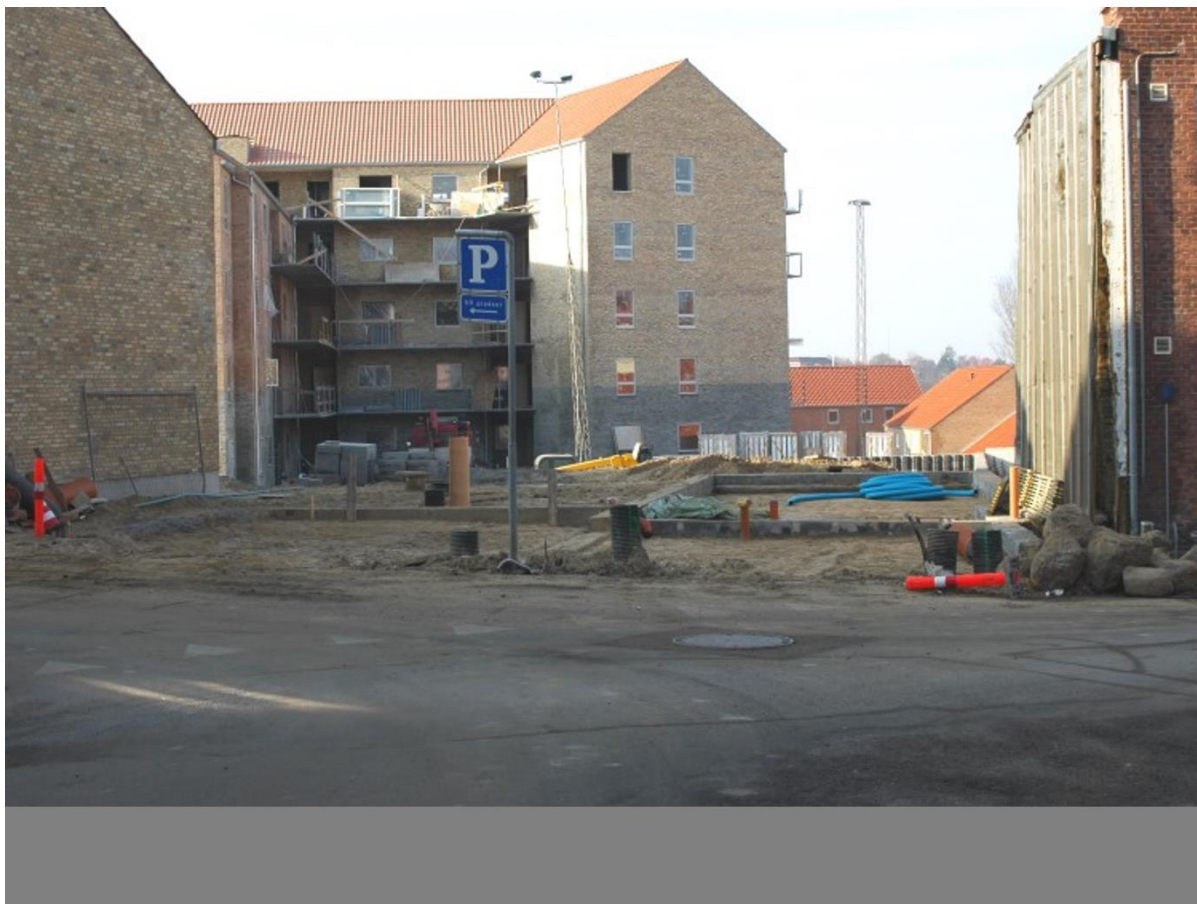
Grunden efter nedrivning - klar til at opføre kopi af husene.