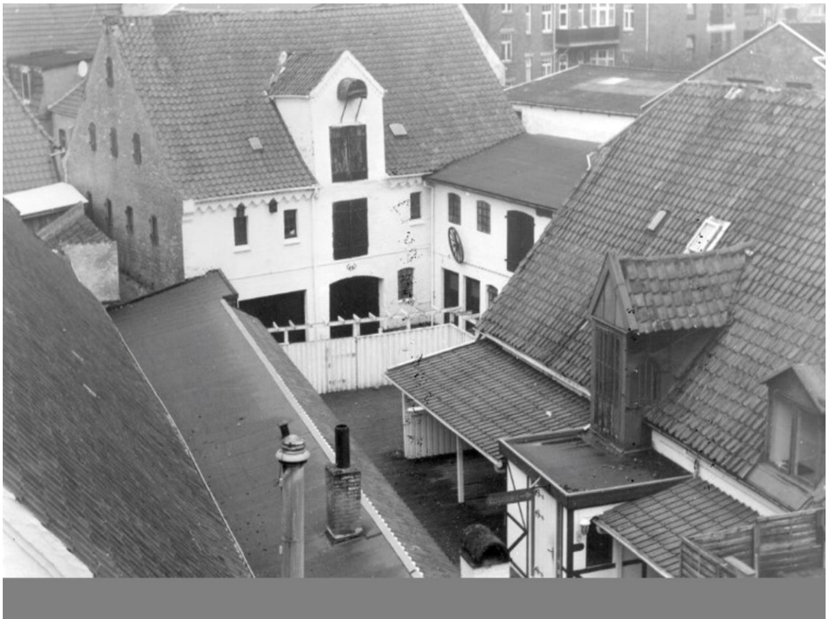
Set fra oven med det gamle lagerhus som ved opførelsen af H&M blev overbygget.