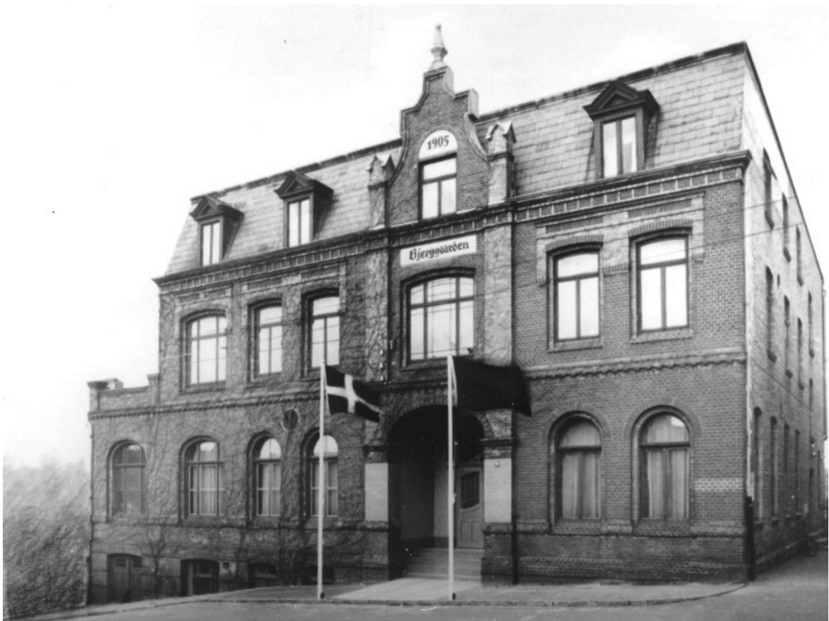
Bjerggården i Bjerggade blev bygget i 1905 En kort byggeperiode fra juli - december 1905. Stedet var samlingssted for byens håndværkere som også havde ydet et bidrag på 10 Pf. om ugen til byggeriet. Stedet blev kaldt Central Herberge.