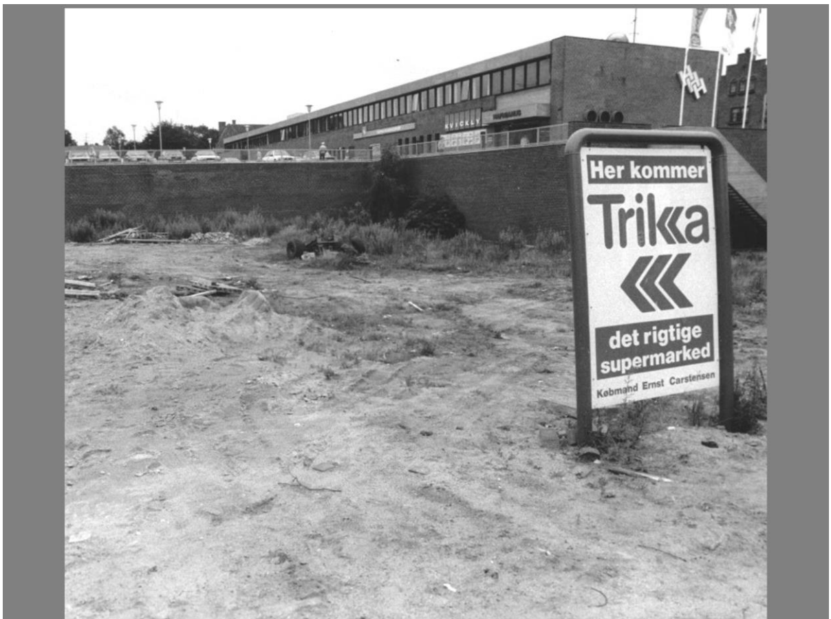
En købmanskæde Trika ville opføre et varehus ved siden af Kvickly. Husene Kastanie Allé 5 - 7 blev nedrevet i 1986.