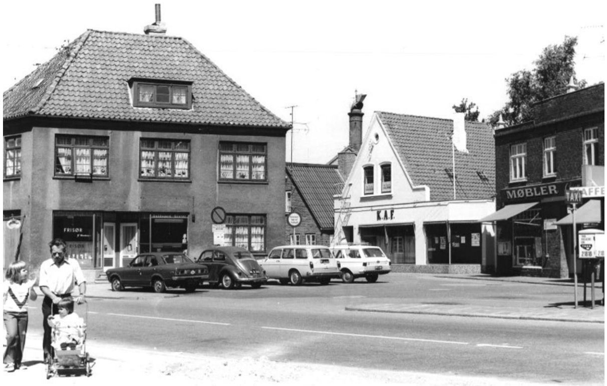
Rønhaveplads med Rønhavegade til højre.