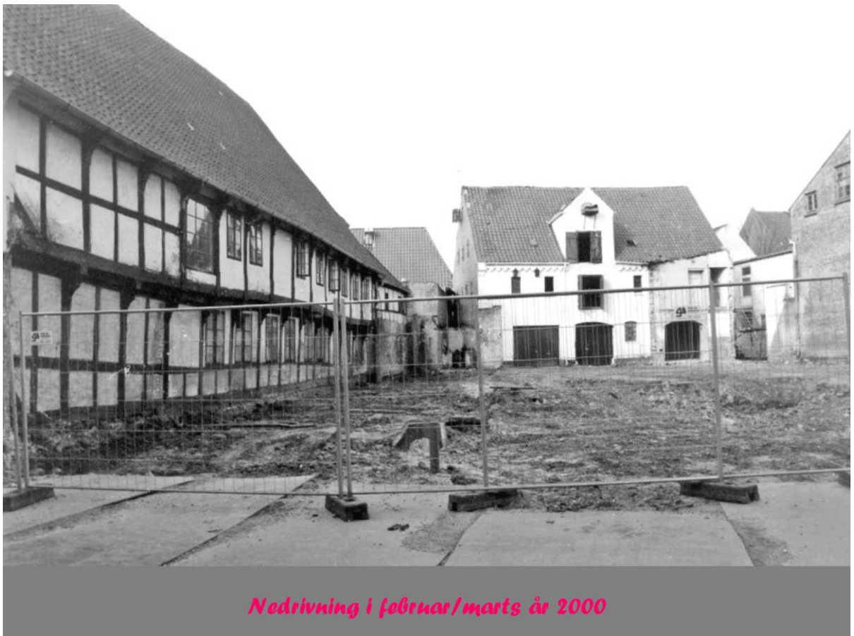
Nedrivning i februar/marts år 2000