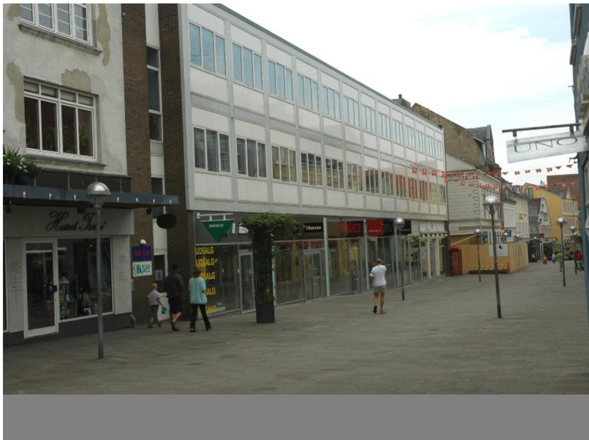
Perlegade 48 - 50 i dag, før Mika Favør i dag tøjbutikker m.m.