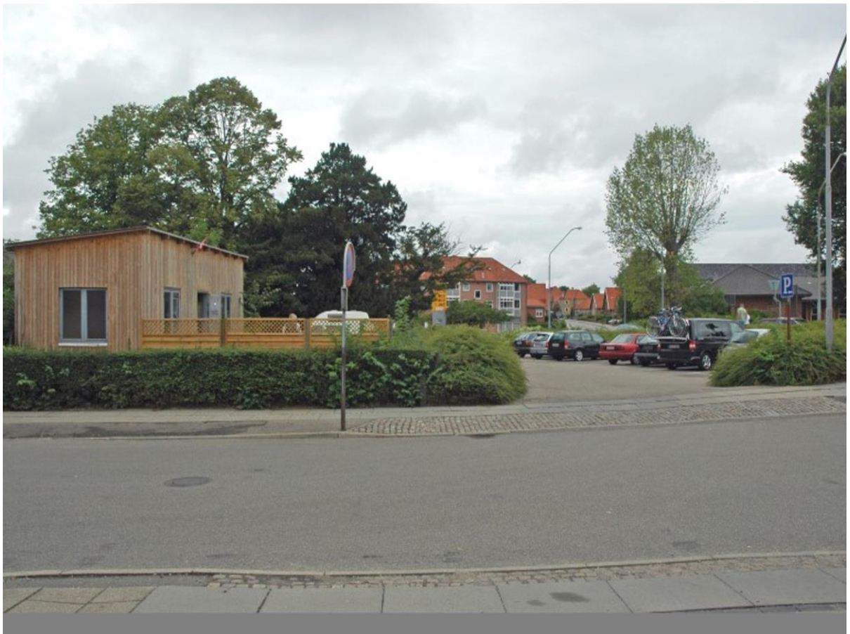
Sct. Jørgens hospital nedrevet marts 1973