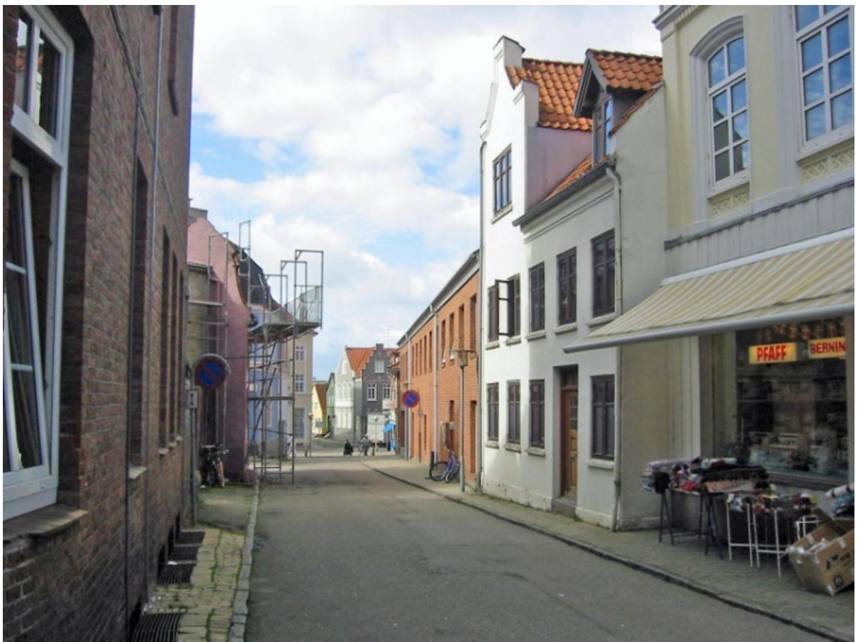
Sct. Jørgensgade - nu fakta i ny bygning.