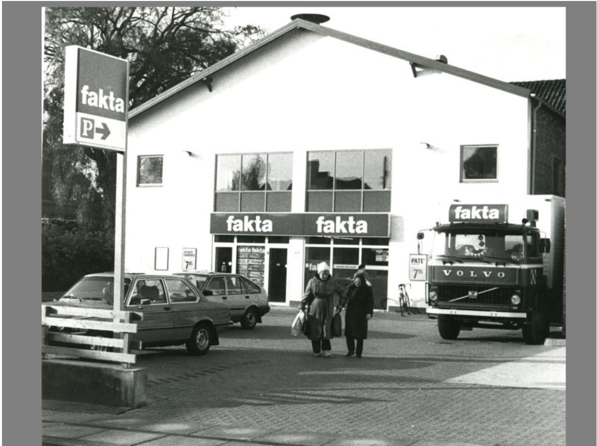
Siden blev det benyttet af FAKTA