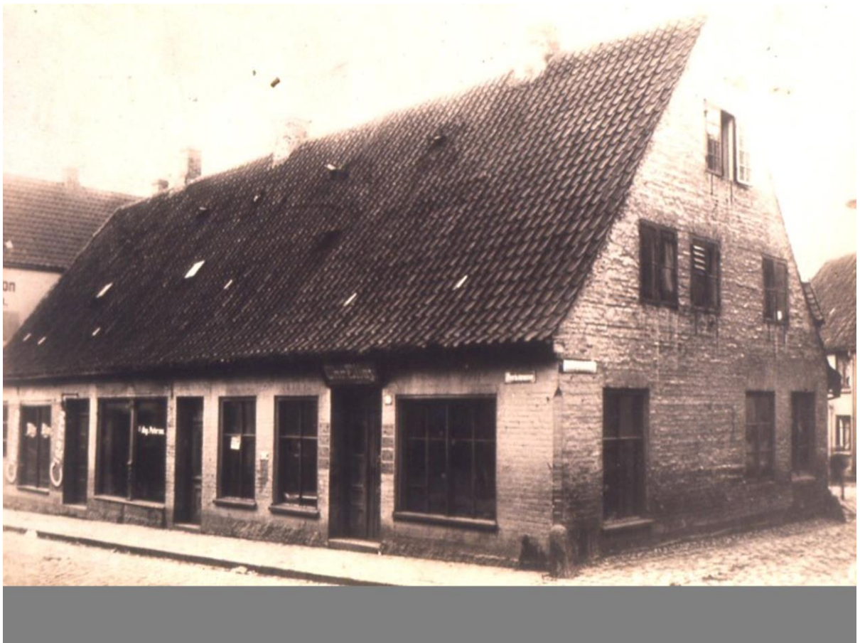
Hjørnet Perlegade / Sankt Jørgens Gade.