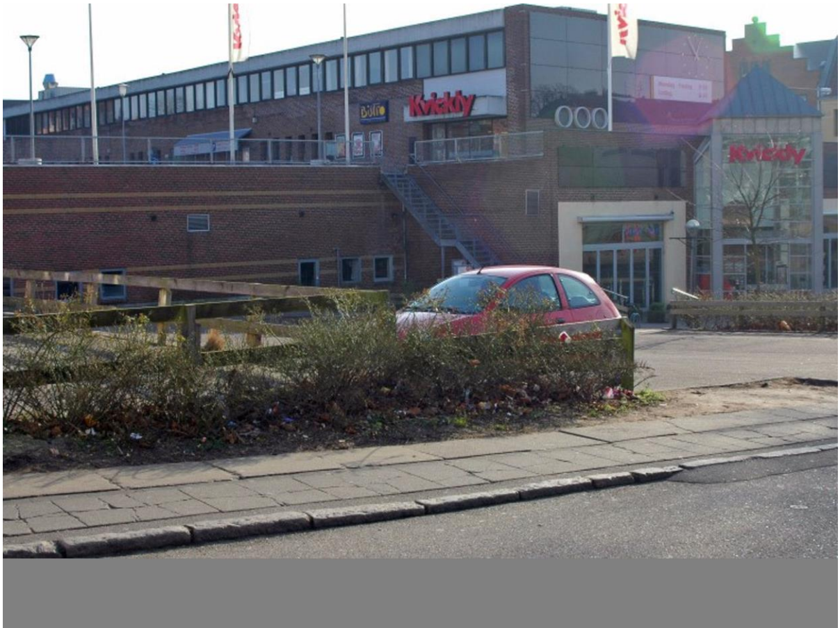
P. pladsen i dag.