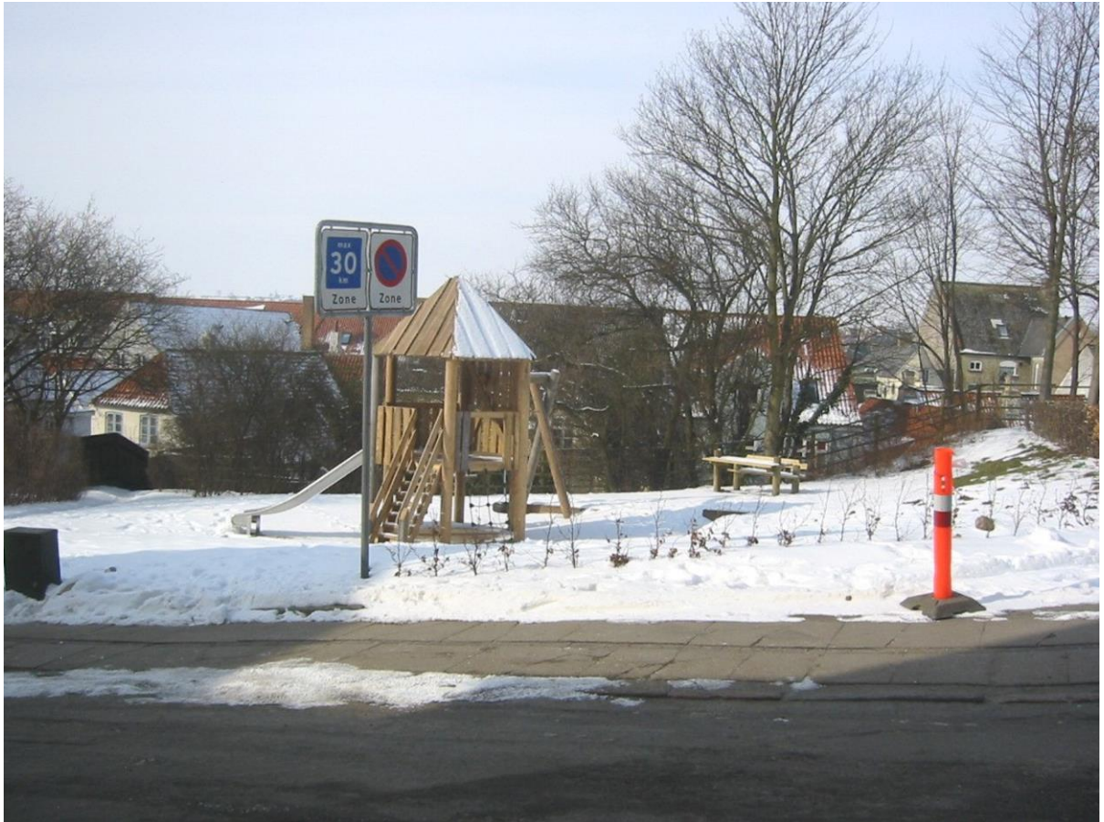
Området hvor Bjerggården lå er legeplads i dag.