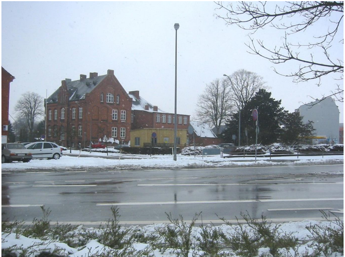
I dag parkeringsplads.