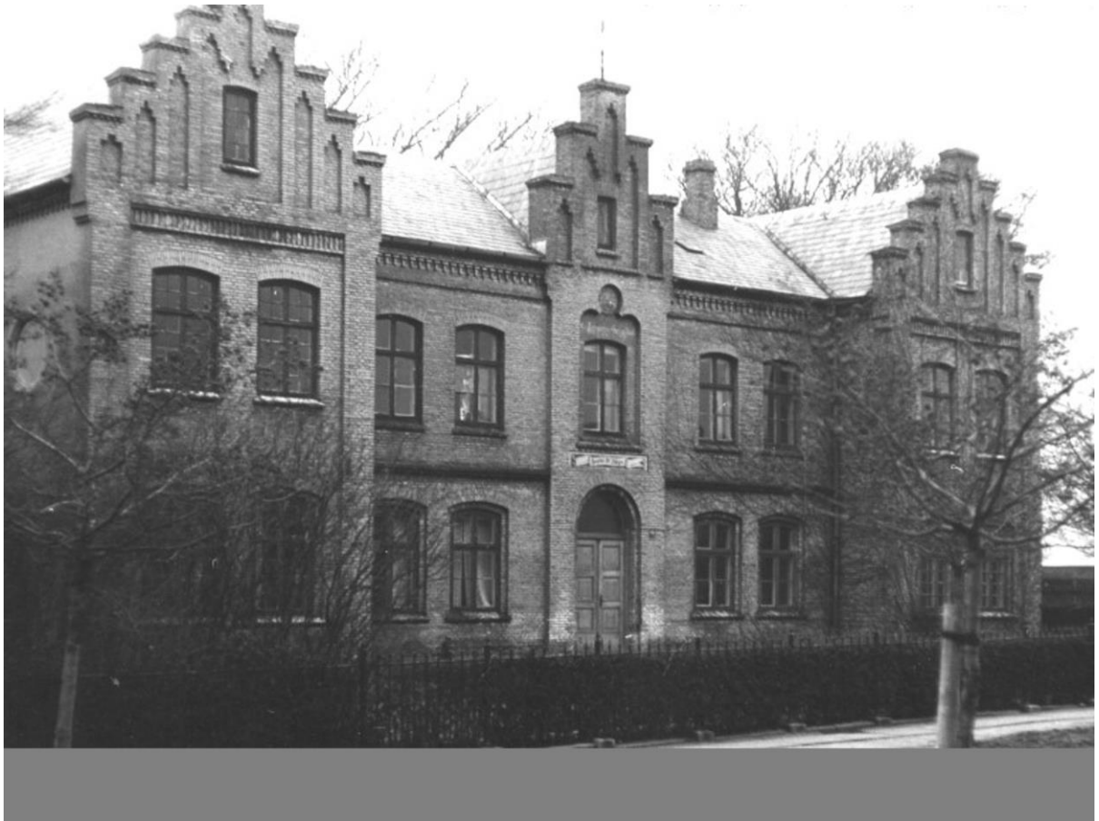
Sct. Jørgens hospital lå nabo til Reimersskolen