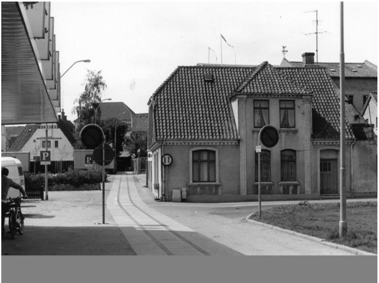
Jernbanestien som den så ud engang. Stien fra Løngang til Perlegade blev også kaldt for "æ gummisti", pga. blød asfalt.