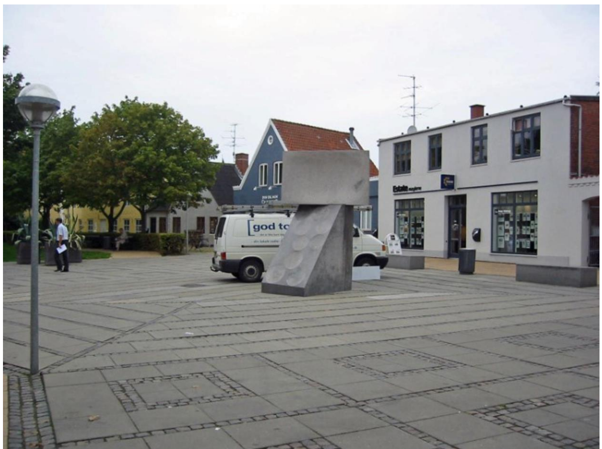
Rønhaveplads i dag.