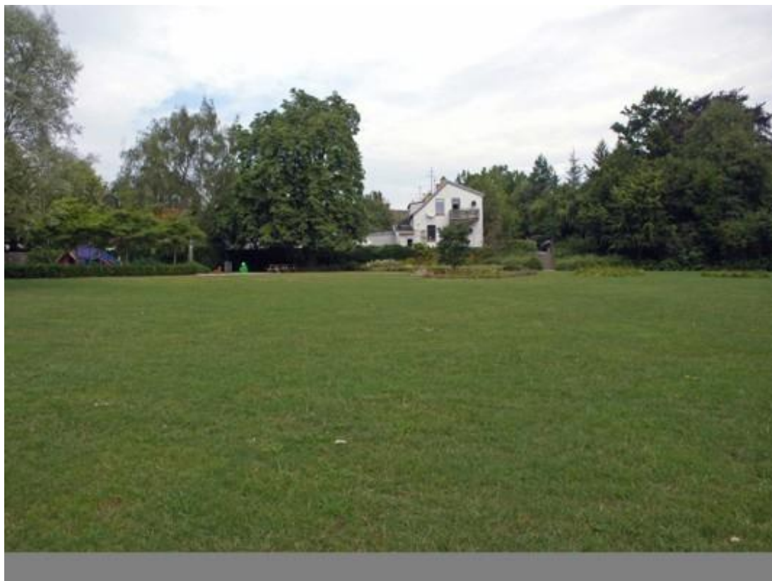
Kongevejsparken i dag.