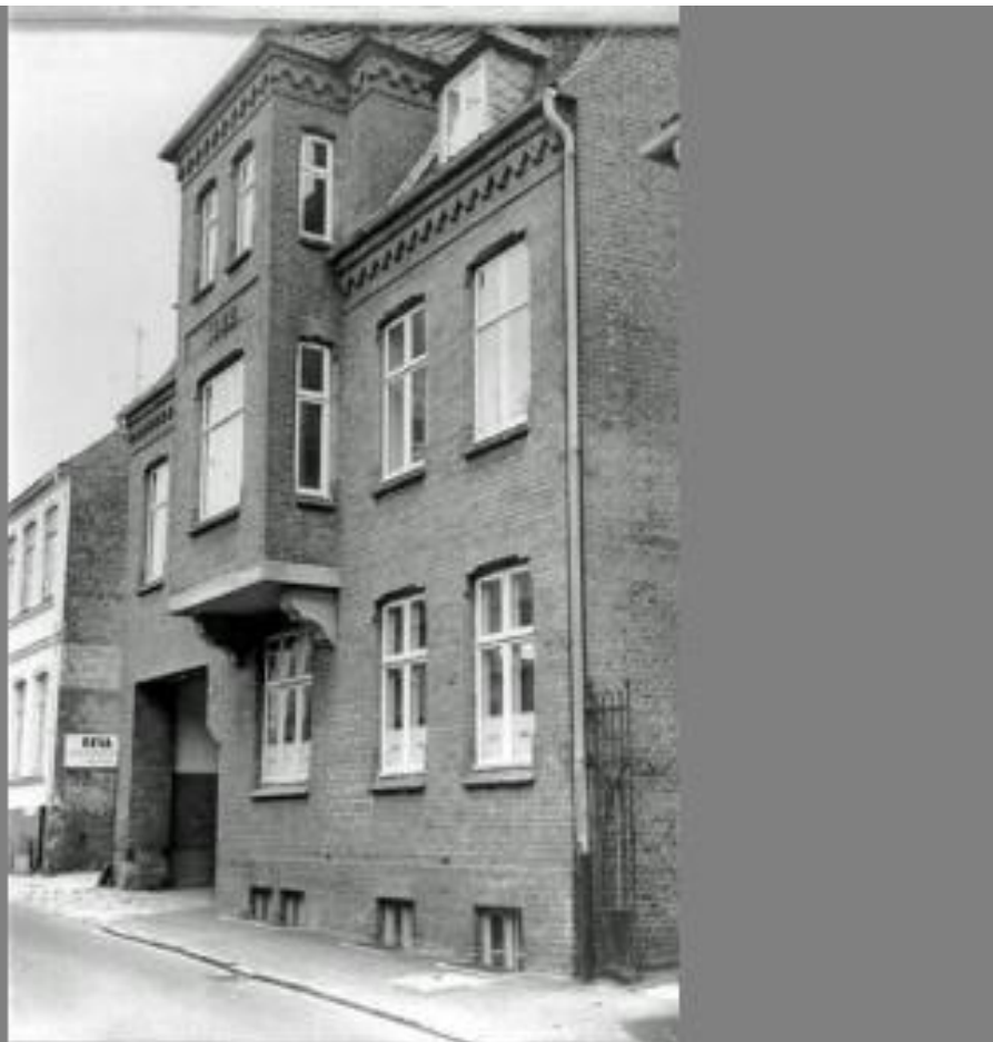
Rosengade 12, Sønderborg Trælasthandel fra ca. 1918.