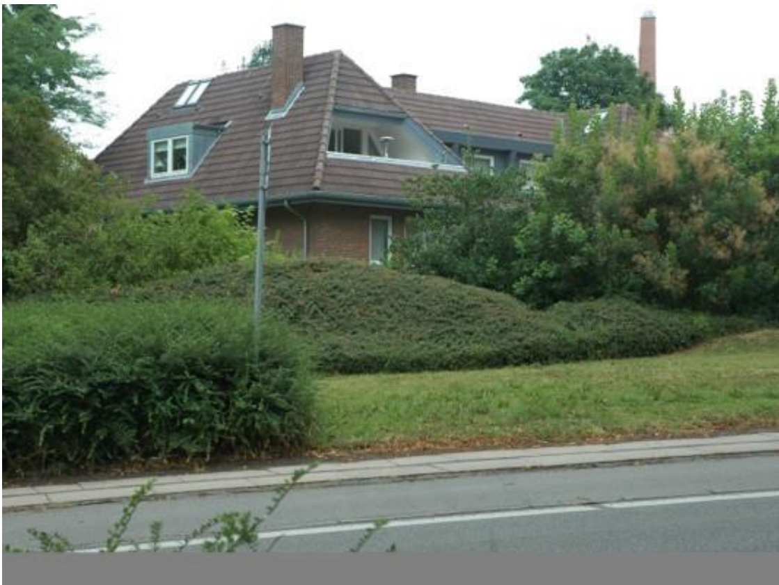
En ny villa blev bygget, er både erhverv og privat beboelse i dag.