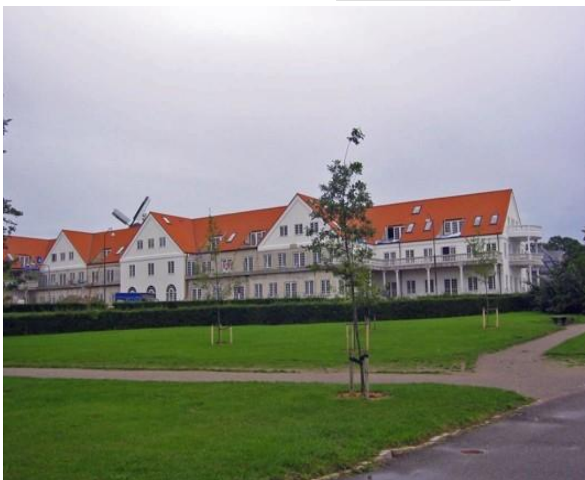
Det nye "Strand" 2006. Private boliger.