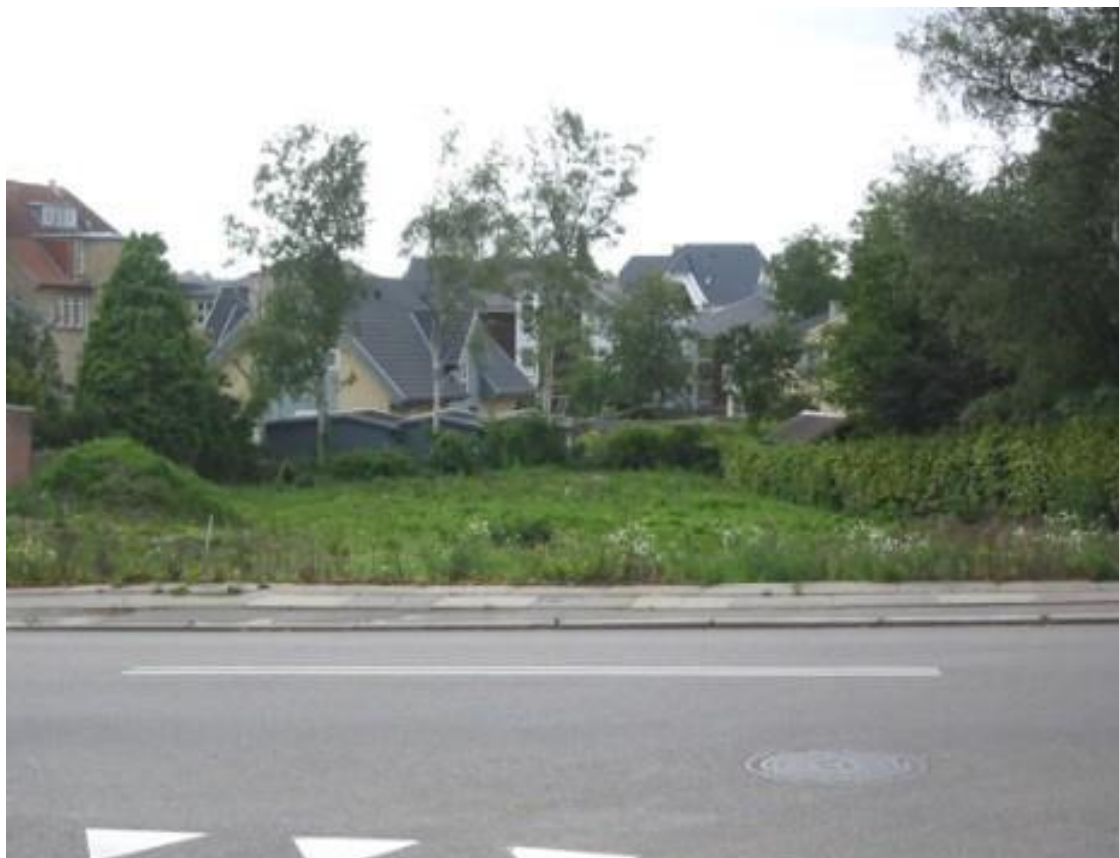
Tilbage ligger grunden i dag – ubebygget.