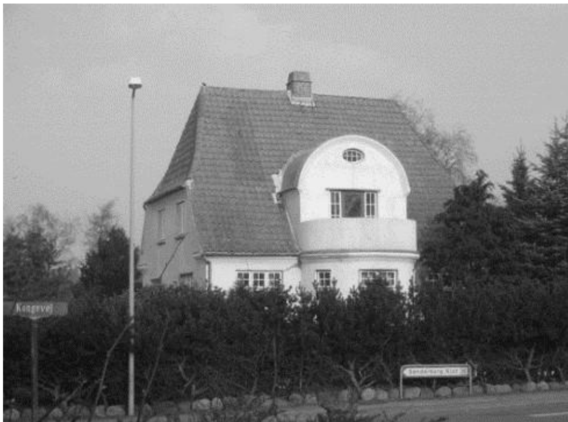
Kongevej nr. 102 nedrevet i 2004, antagelig fordi der var sætninger i huset.