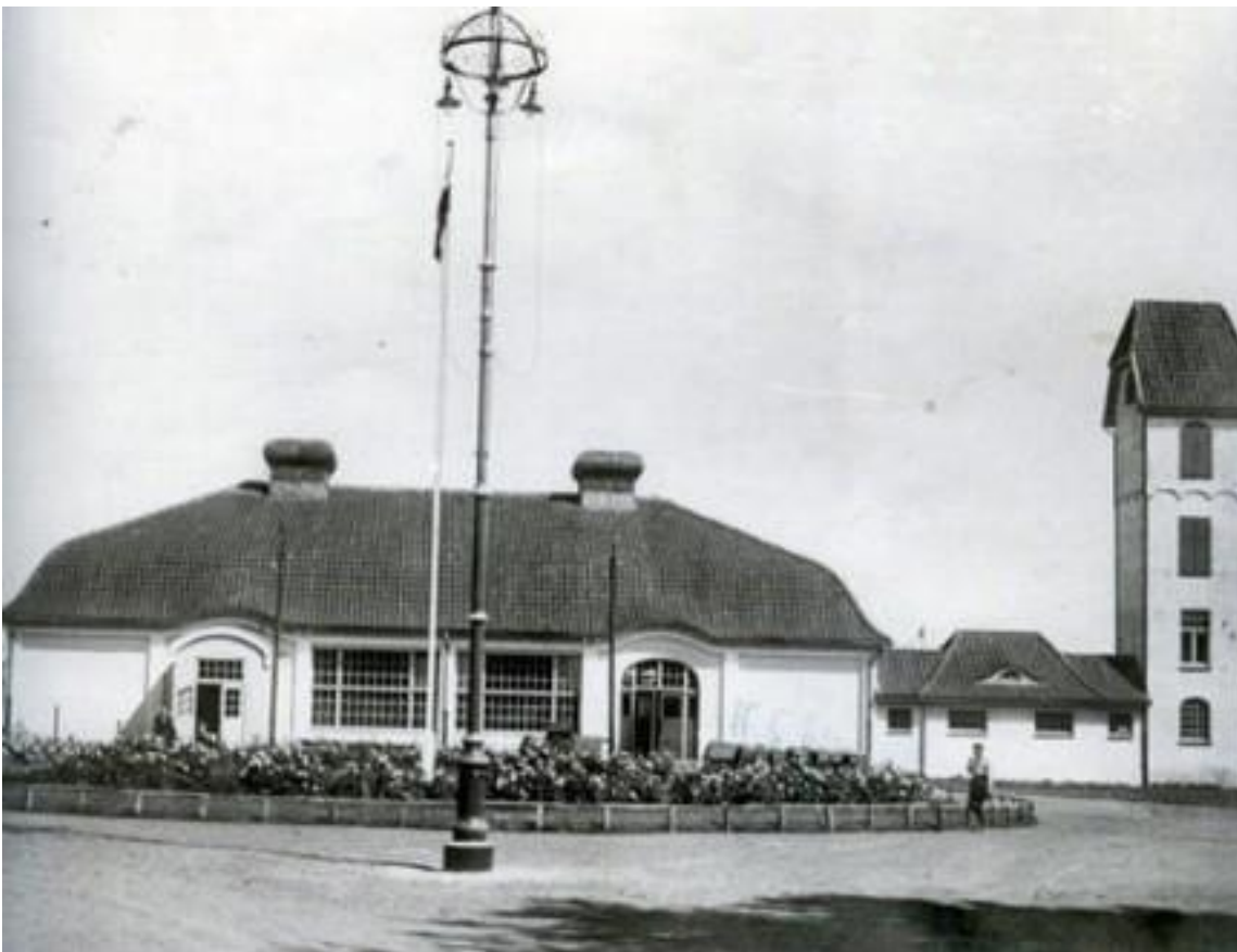
Ringryderhallen med tårn til tørring af brandslanger opført i 1909 i forbindelse med den første ringryderfest på den nye plads. Hallen blev nedrevet i 1965.