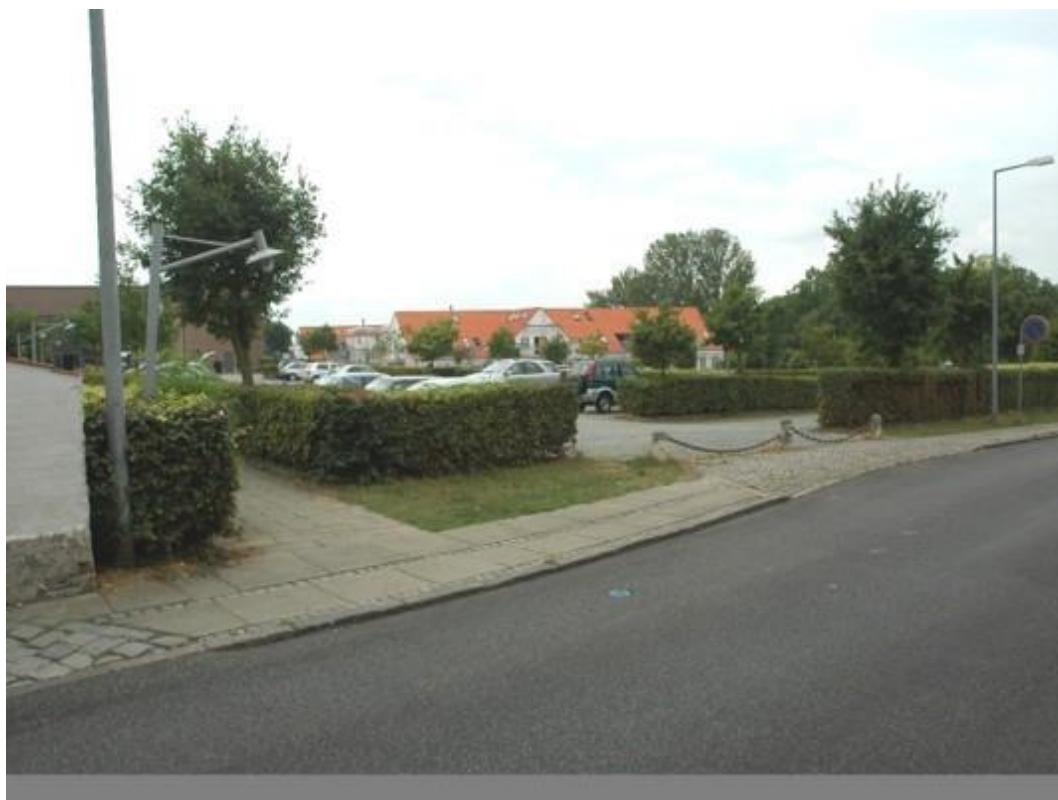
Rosengade i dag - P plads for Comwell Hotel.