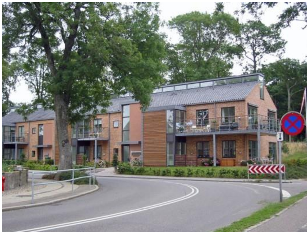
Ejerlejligheder opført 2003 - 04 seks ejerlejligheder.