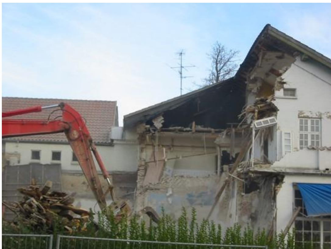
Nedbrudt 2004 – 2005.