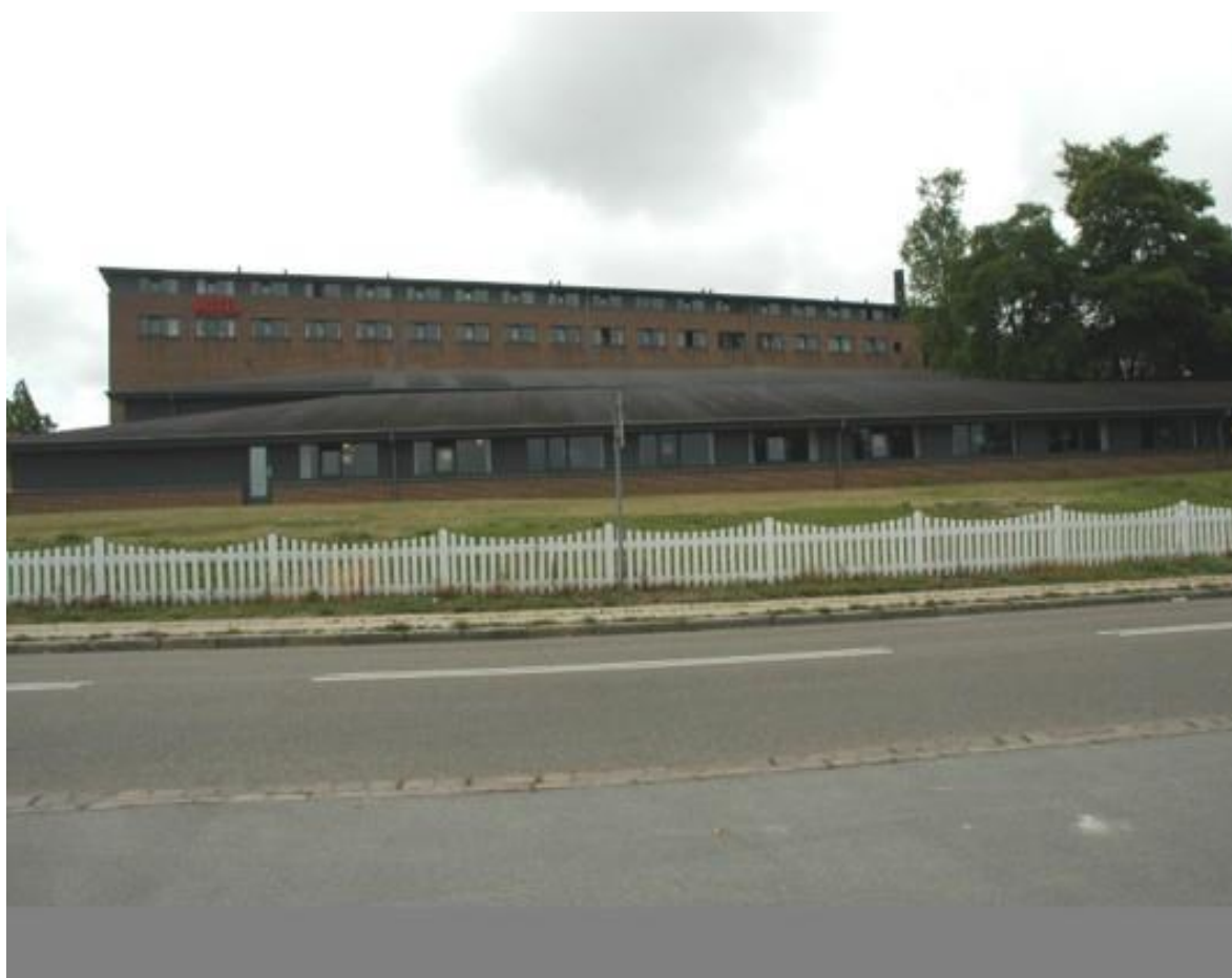
Nu Comwell – værelsesfløj.