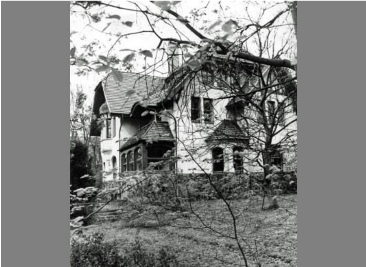
På hjørnet af Kongevej/Hertug Hans Vej lå Brüning villa. Da den sidste datter døde blev villaen testamenteret til Handelsstandsforeningen som senere solgte ejendommen til Kommunen. Bygget i 1908. Kongevej nr. 73