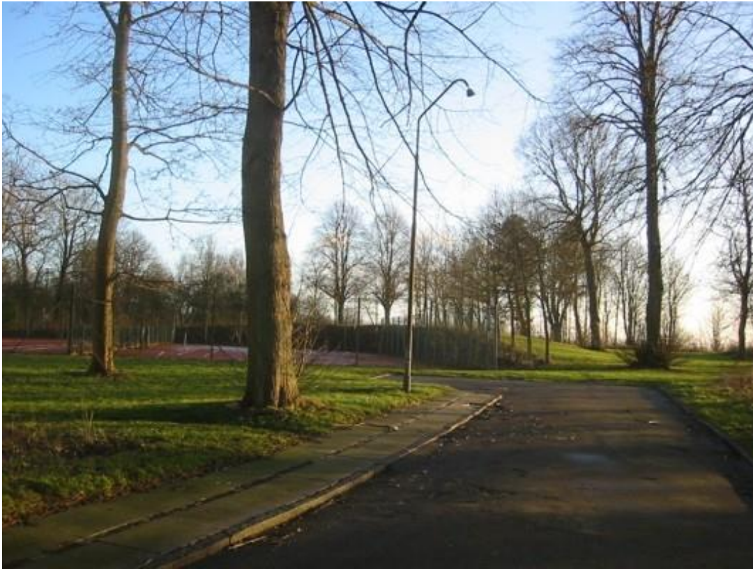
Vejen ind til Kurhotellet.