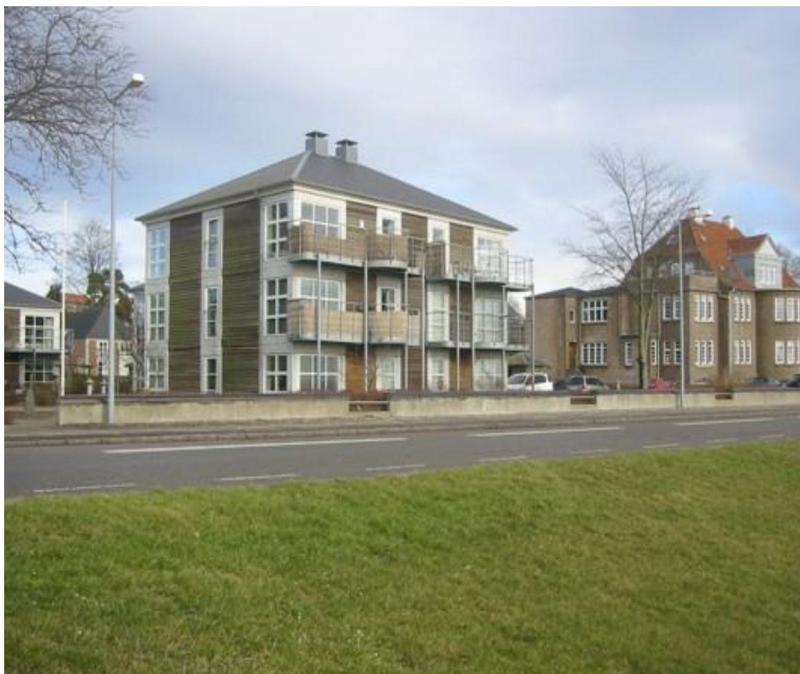
Nye punkthuse opført 1984-85.