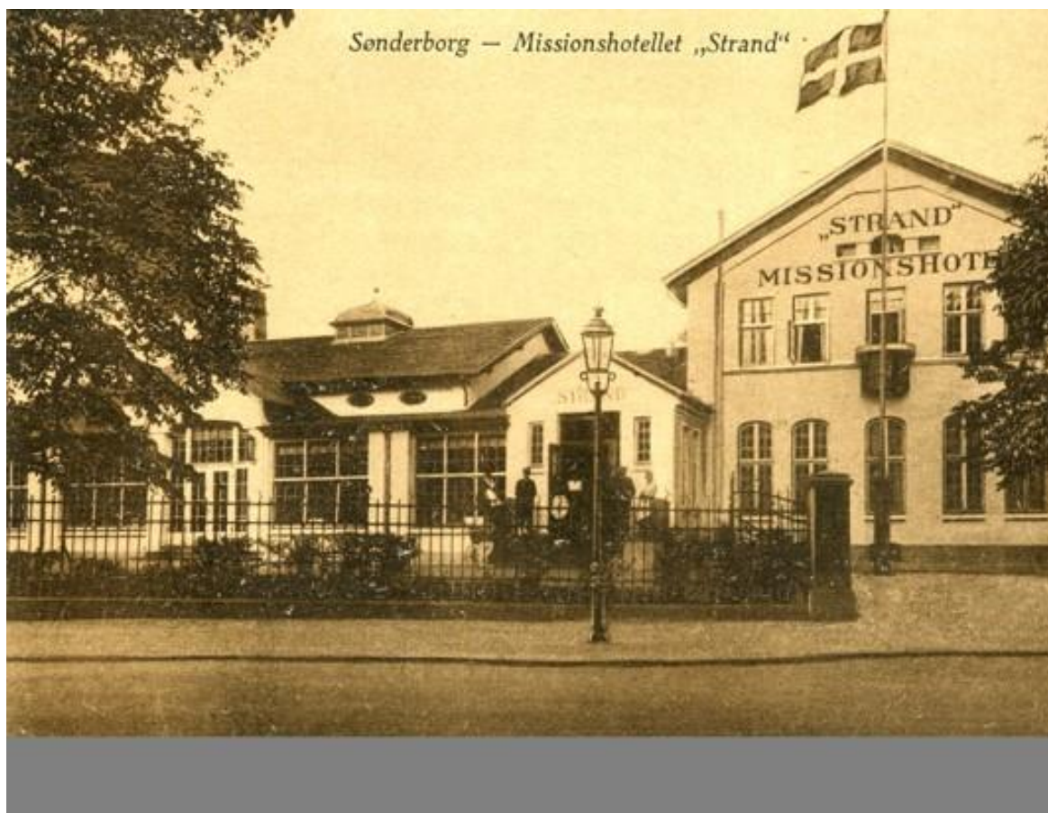
Strandvejen - Missionshotel Strand - Hotel Strand - Efterskolen Strand pensionisthøjskolen. Gasværk indtil 1906.