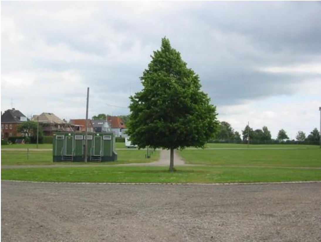
Ringriderpladsen i dag.