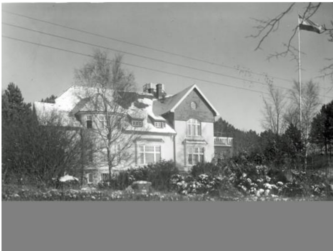
Strandvej 3, Van Thornborgs villa DNA - Kamgarn nedrevet 1983.