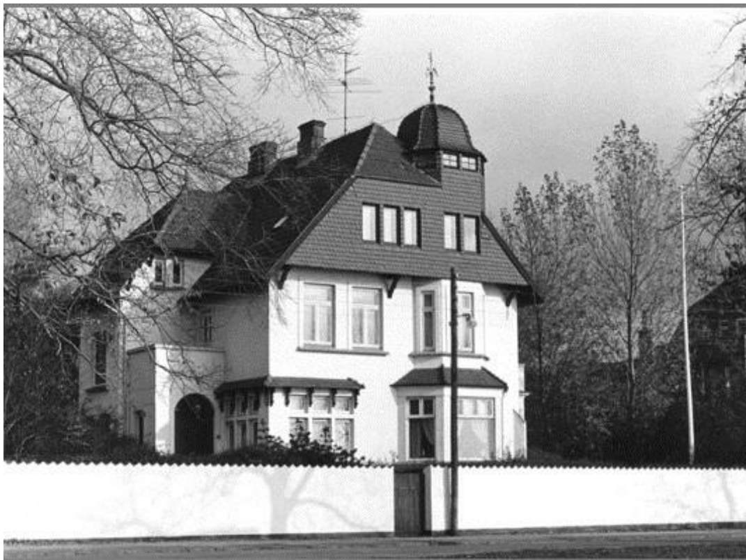
Strandvej 17. Tandlæge Ewalds villa nedrevet 1983 i juli måned huset lå på en 7000 m2 stor grund.