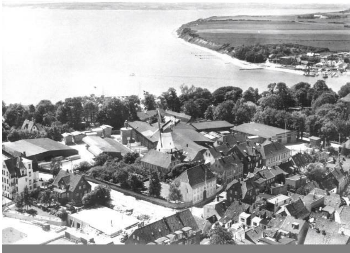
Luftfoto af Trælasthandel fra ca. 1970-72