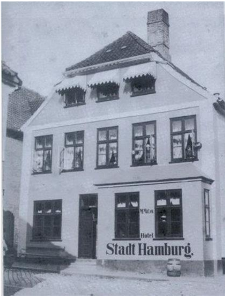
Stadt Hamburg , Perlegade 36, i dag Jensens Bøfhus.

Café Løkken og Centrum Frugt Det var her at Sønderborg Teater havde til huse fra 1845 til 1906. I haven, som strakte sig helt ned til Løngang, var der en dobbelt keglebane og mulighed for udendørs servering. Huset virkede som hotel indtil 1920, hvorefter der blev indrettet slagtebutik og en skobutik. I teatersalen fandtes nogle kalkmalerier blandt andet af Dybbøl Mølle og havemuren i Lillegade — Hertug Ernst Günthers Palæ.