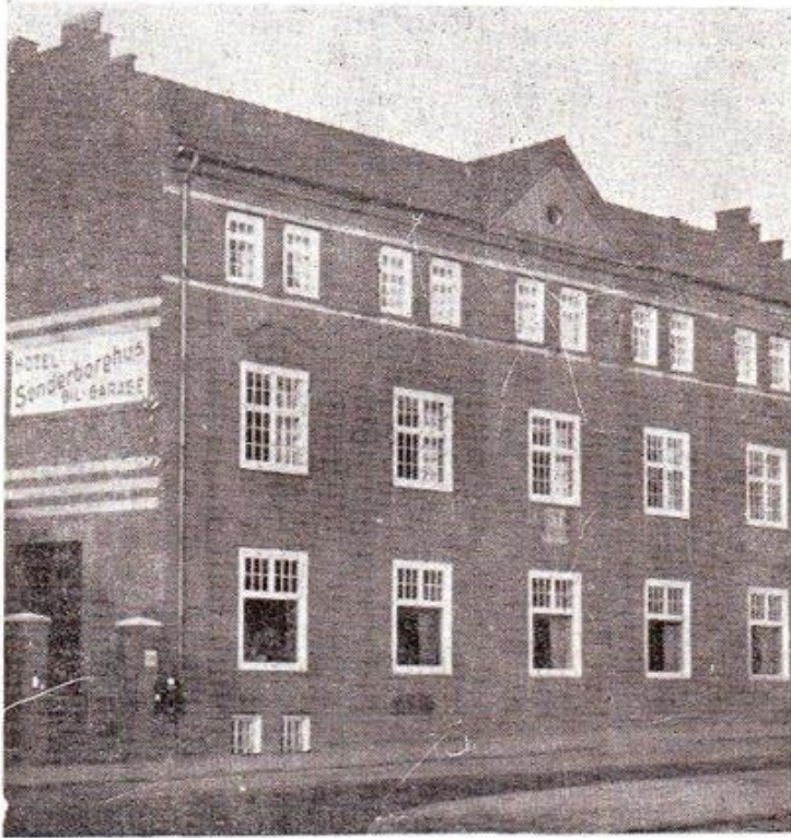
Reklame for Sønderborghus