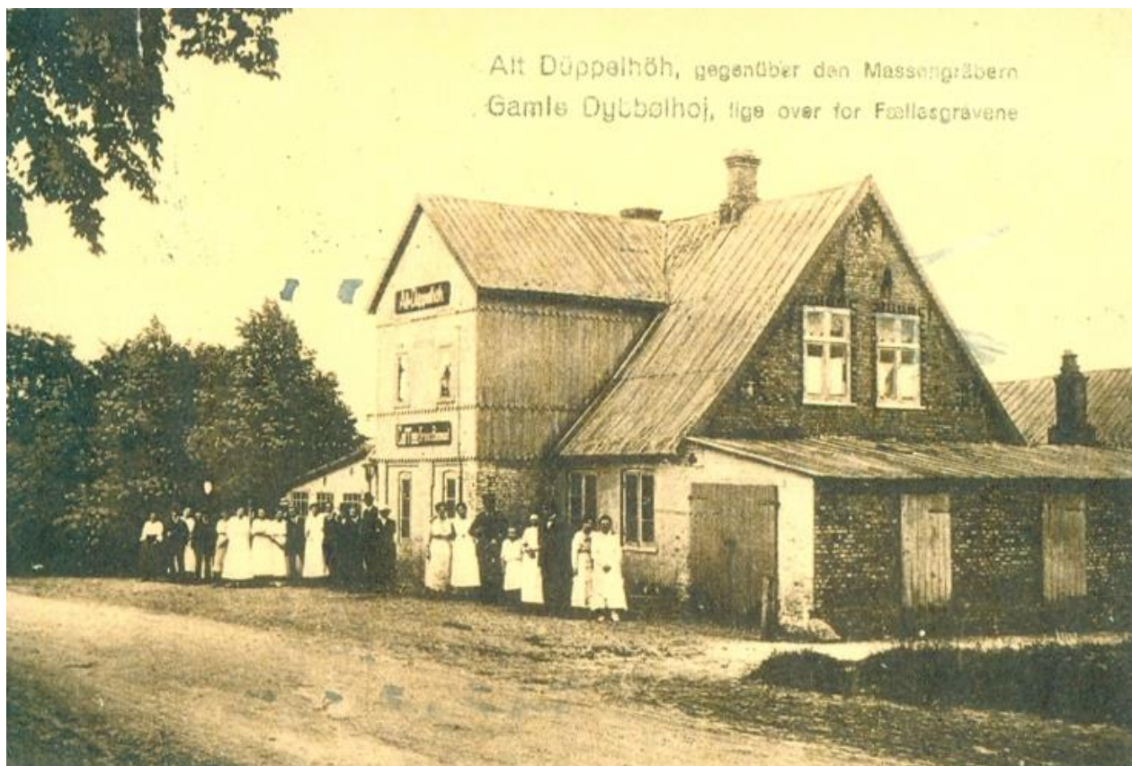
Alt Düppelhöh, gegendüber den Massengräbern Gamle Dybbølhoj, lige over for Fællesgravene