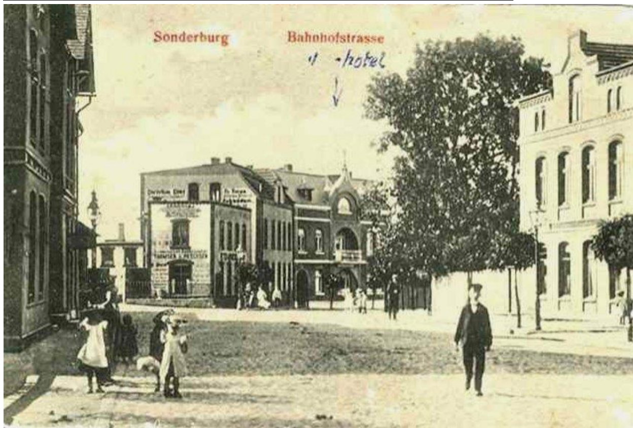
Bahnhofmotel, Jernbanegade lige i nærheden af den nye banegård fra 1897-98.