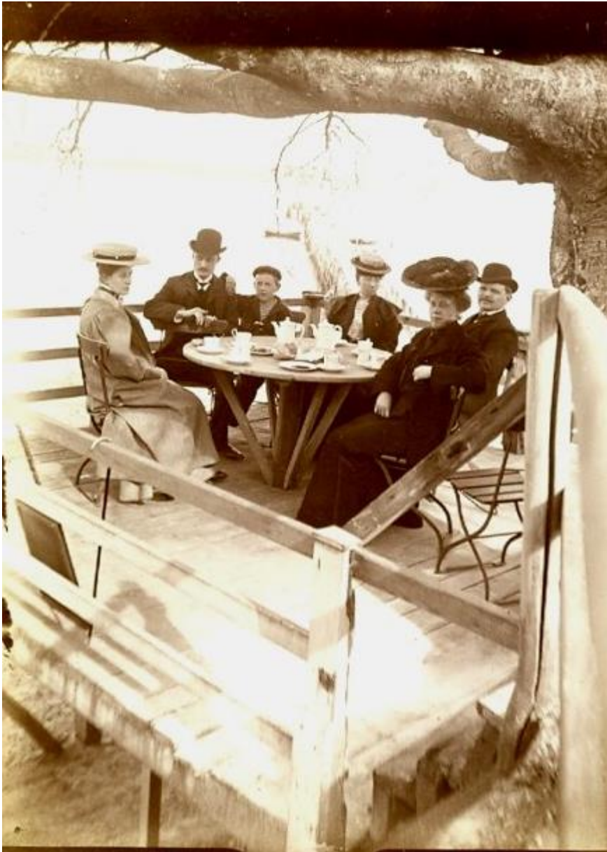
Stedet blev opkaldt efter det sted, hvor man sidde i det fri under et bøgetræ.