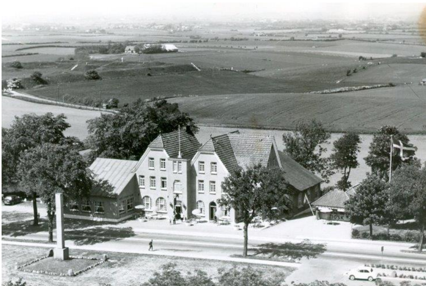
Hotel Dybbøl Banke Hotellet set fra luften uden tårn.