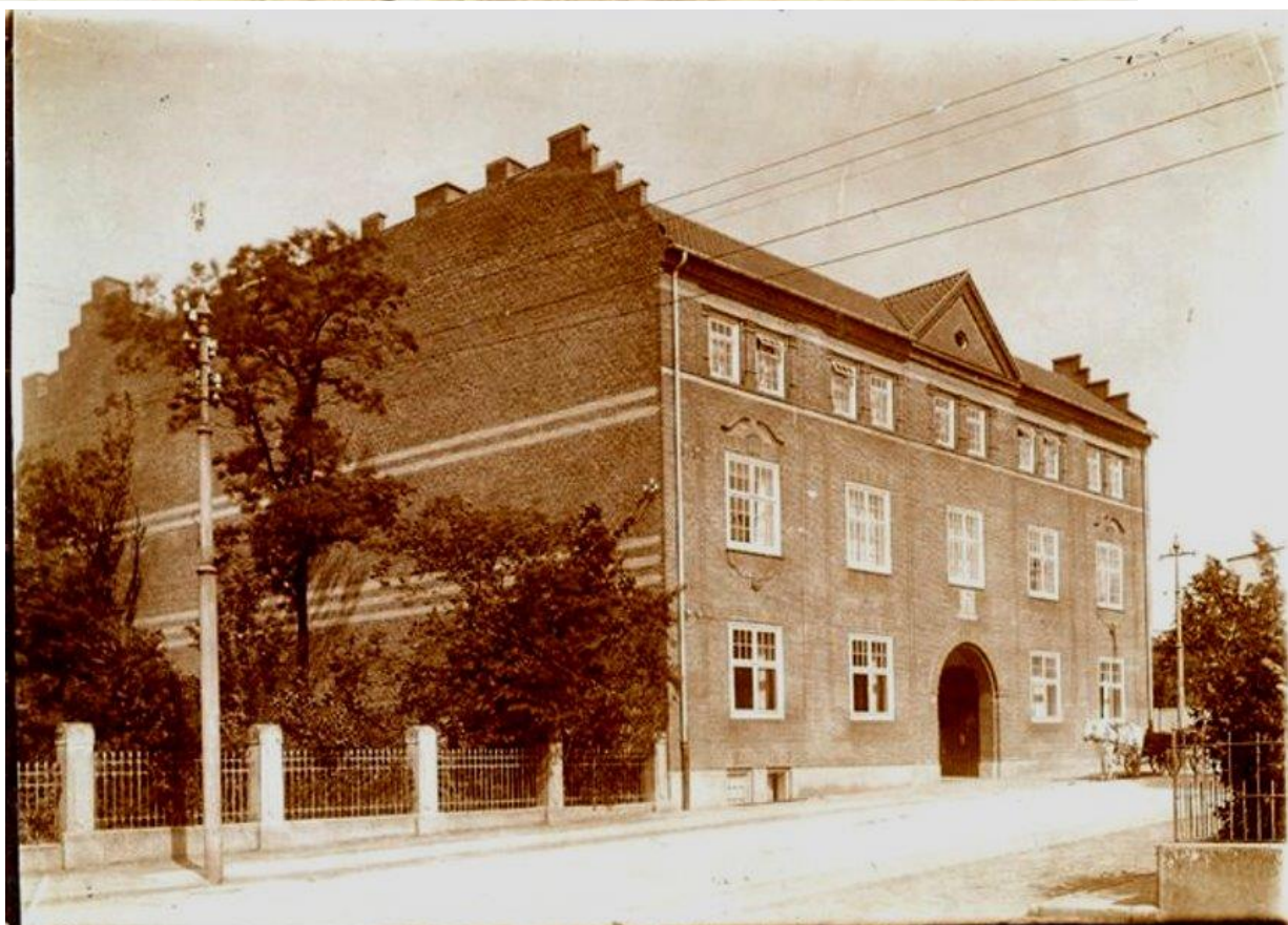
Sønderborghus blev bygget som dansk forsamlingshus i 1913-14 og var tegnet af Martin Nyrop. Efter at det var færdigt gik der nogle år inden det kunne virke som forsamlingshus, i krigen som startede i 1914 blev huset anvendt som fængsel og til mange andre ting. Efter krigen var det forsamlingshus og borgerforeningen havde til huse her. Det kunne ikke gå rundt og derfor blev det indrettet som hotel, med underholdning og dans i salene.