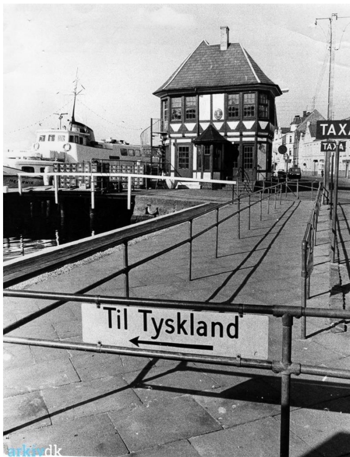
I en årrække blev Dampskibspavillonen brugt som toldkontrol for spritbådene.