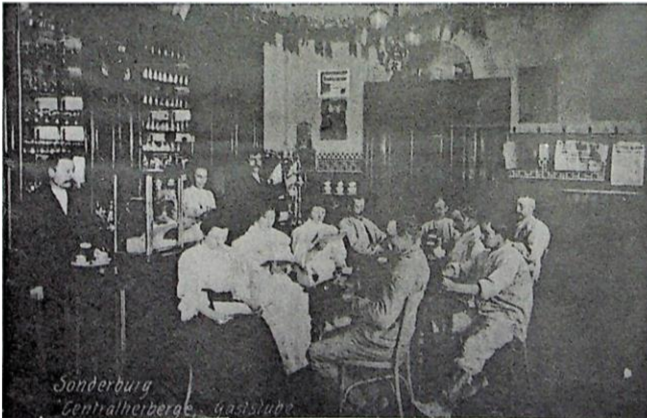
Bjerggårdens krostue – fra før 1920

Det betragtedes som en selvfølge, at de organiserede arbejdere også var medlem af den socialdemokratiske forening, og næsten hver søndag tog et hold på landet med socialdemokratiske flyveblade, nogle steder blev de modtaget med stenkast.