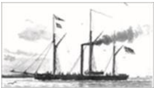
Skruekanonbåden "von der Tann" som nybygget i 1849. Ved istandsættelsen i 1851 fik kanonbåden kun to master og skorstenen blev flyttet længere agterud Senere tegning af L. Arenhold

Vraget blev senere på året hævet og bragt til Kiel, hvor det blev genopbygget, så von der Tann i sommeren 1851 genopstod "wieder neu wie ein Phönix aus der Asche" – men kun for en kort tid.