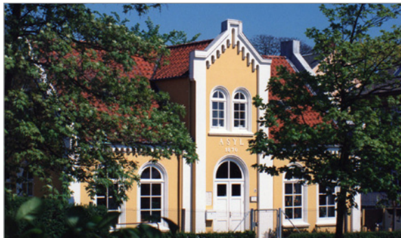
Asylvej 2005-2021 (foto fra før 2017)

Men i 2003 besluttede Sønderborg Byråd at nedlægge Kirke-torvets Børnehave. Bygningen stod på det tidspunkt med et svampeangreb, som ville koste 1,6 mio. kroner at udbedre, men uden garanti for at svampene ikke ville komme igen. Kulturudvalget besluttede imidlertid at ofre beløbet på at få renoveret børnehaven, men den blev kort efter nedlagt sammen med Børnehaven Jørgensgård og senere flyttet til en nybygget institution.