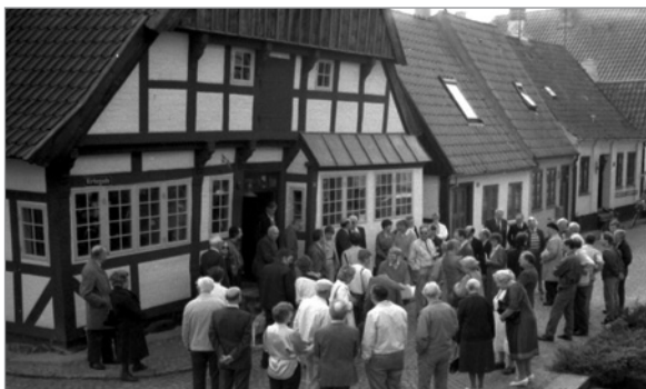
Lokalhistorisk Arkiv, Kirkegade 1987-2005