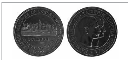
For- og bagside af mindemedalje som sigter til en feltgudstjeneste ved Hjertehøjen i Gråsten slotspark søndag den 7. september 1890 kl. 10

lystbådehavn. De mange deltagende skibe lå opankrede i to rækker, og Hohenzollern med kejseren ombord, fulgt af krydserkorvetten Irene under kommando af kejserens bror, prins Heinrich, passerede to gange skibsrækken under en øredøvende salut af en halv times varighed. Og hermed var manøvren slut.