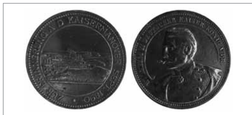
For- og bagside af mindemedalje som sigter til flådens deltagelse i manøvren fra Vemmingbund

Manøvren sluttede kl. 6 om morgenen onsdag den 10. september