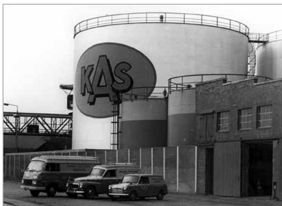
Kulhandel Aktieselskab i 1960'erne (ud fra bilmodellerne)

En af de virksomheder, der satte præg på havneområdet og bybilledet, var Kulhandel Aktieselskab med de karakteristiske siloer/olietanke.