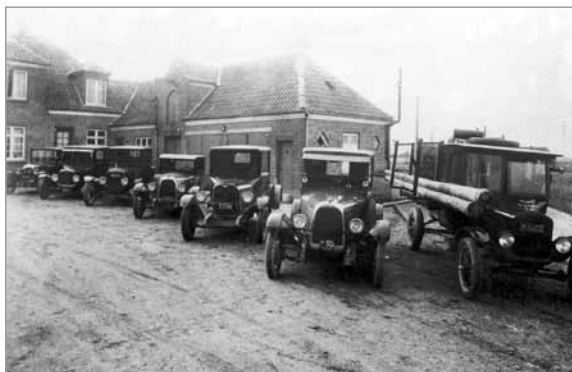
Kulhandel Aktieselskabs vognpark i 1930'erne

I starten handlede man med fast brændsel, kul og koks. De store mængder krævede et stort område og – som det ses på billedet – egen kran til losning af skibene og læsning af lastbiler og togvogne. Nogle af togvognene kørte ad den smalsporede jernbane langs sydhavnen og stranden ud til gasværket på Skovvej.