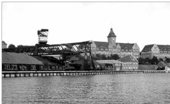
Kulhandel Aktieselskab set op imod kasernen, formentlig midt i 1900-tallet

I starten handlede man med fast brændsel, kul og koks. De store mængder krævede et stort område og – som det ses på billedet – egen kran til losning af skibene og læsning af lastbiler og togvogne. Nogle af togvognene kørte ad den smalsporede jernbane langs sydhavnen og stranden ud til gasværket på Skovvej.