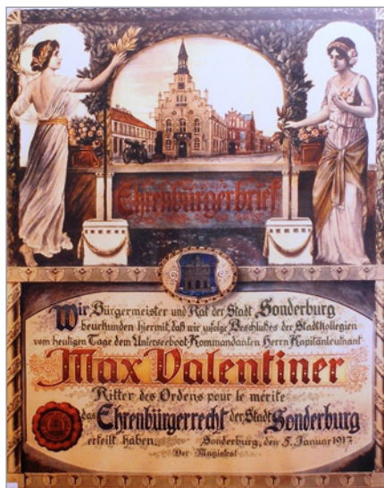
Kopi af æresborgerbrevet

Mellem de to felter er Sønderborgs byvåben indsat.