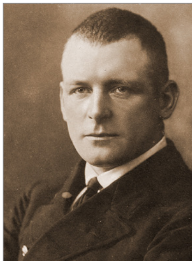
Kaptajnløjtnant Max Valentiner

Den 26. december 1916 fulgte så tildelingen af den højeste tyske orden, Pour la Mérite, efter en dristig aktion, hvor tre fjendtlige skibe