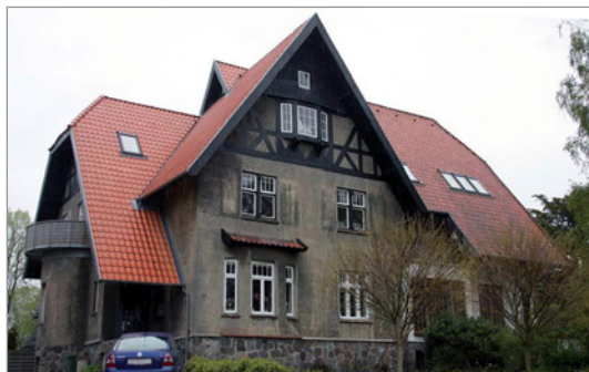
Asylvej 9 ca. 2010 (privat foto)