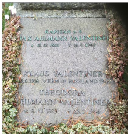
Valentiners familiegravsted på Marie Kirkegård

I en nekrolog i Der Nord-schleswiger 25. juni 1949 fortælles det, at han døde i Sønderborg af en nyresygdom, som stammede fra forgiftninger fra de lange ophold i u-både under første verdenskrig. Personregistret for Sønderborg