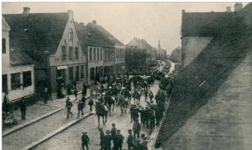
Kreds-Ringriderfestens første festtog gennem byen 1888

Den første fest fandt sted 22. og 24. juli 1888, og komiteen havde held med sig: Der meldte sig over hundrede ryttere, og præmiernes antal måtte forøges fra fem til tolv.