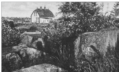
1938. Postkort fra ca. 1925

Genåbningen af værftet hilstes, i hvert fald i starten, med en vis tilfredshed. Det gav nemlig beskæftigelse til mange. I 1944 således 202 arbejdere i januar jævnt stigende til 292 ved årets udgang. Medaljens bagside viste sig imidlertid hurtigt: værftet arbejdede nemlig stort set kun med reparation og ombygning af tyske skibe, ikke mindst skibe som tilhørte eller brugtes af den tyske krigsmarine. Formelt set var værftet ganske vist selvstændigt, men i realiteten var det et datter selskab af Liefergemeinschaft der Deutschen Berufsgruppen in Nordschleswig, stiftet i 1940 med det formål at skaffe hjemme tyskere fordelagtige leverancer til værnemagten. Som et blandt talrige eksempler kan nævnes ombygning i 1944 af en fire-mastet træbygget skonnert ved navn "Atlas" til brug som vagt-