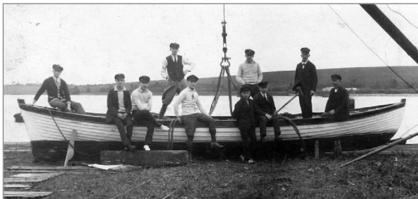
Robåd skænket af Kolbe til Ruderverein Germania 1924

skib. Det knap 60 m lange og ca. 11 m brede skib blev indrettet til en besætning på seks officerer og underofficerer og 24 menige; det blev bestykket med antiluftskyts i form af to stk. 37 mm og to stk. 20 mm kanoner, hvoraf den ene var i firlingaffutage samt maskingeværer.